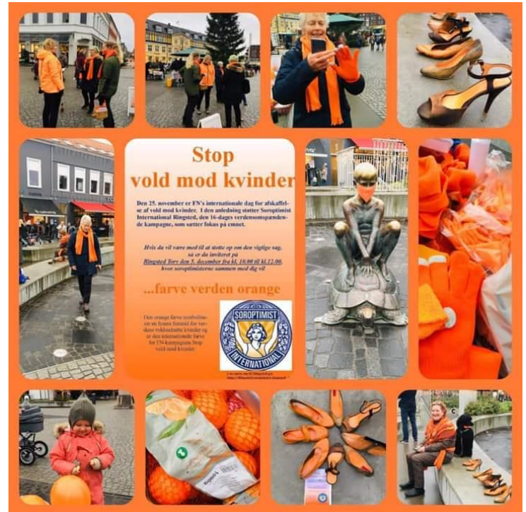
Orange dage på torvet i Silkeborg