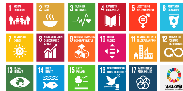
FN's 17 Verdensmål

Udstillingen viser 17 malerier, 17 akvareller og 17 lyriske tekster, som alle er inspireret af FN's 17 piktogrammer.