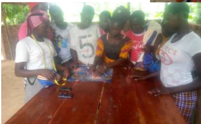
Undervisning i mønster og klip