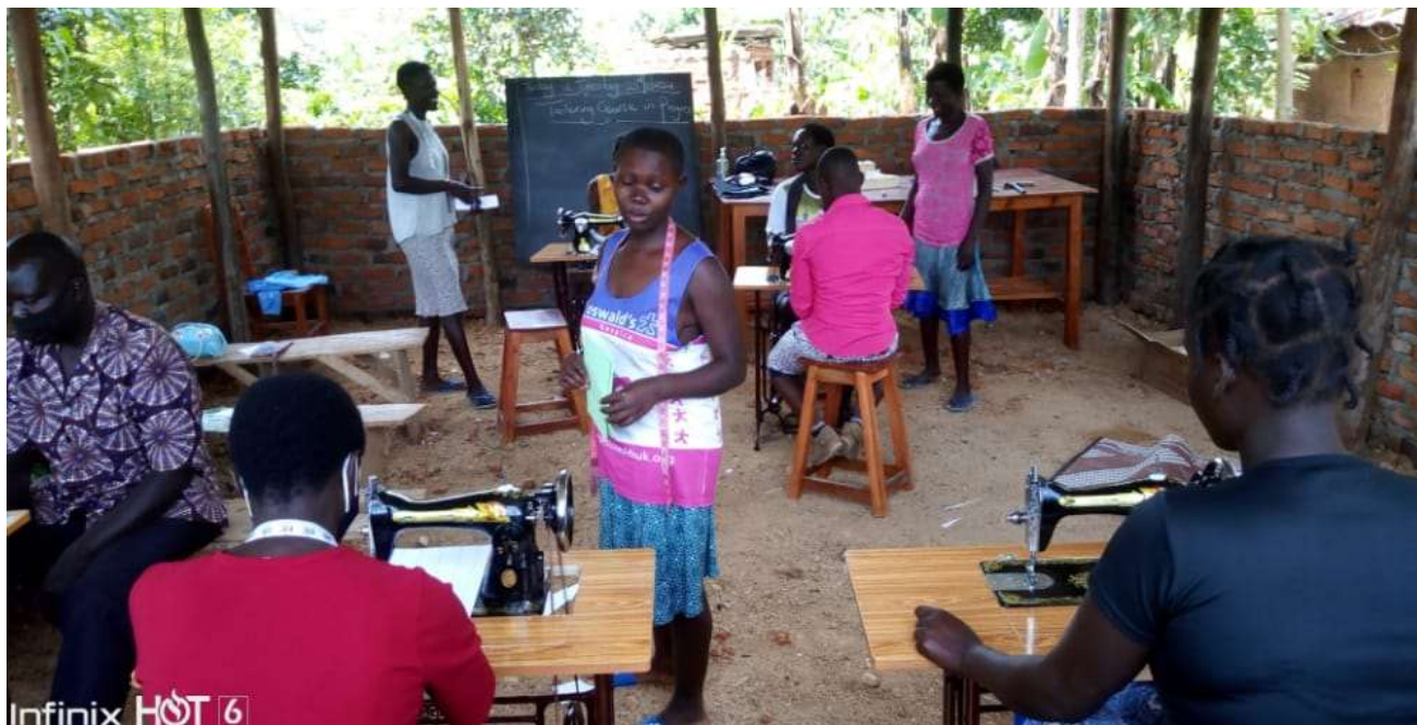
Undervisningslokale – der er indkøbt symaskiner, symaskineborde, stole, tavle, klippebord Læg mærke til den naturlige udluftning i bygningskonstruktionen ☺ Symaskinerne opbevares i aflåst lokale, når der ikke undervises.