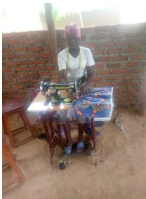
De studerende lærer at sy i forskellige materialer