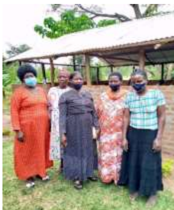
Tilsyn med projektet af lokale Soroptimister fra SI Tororo