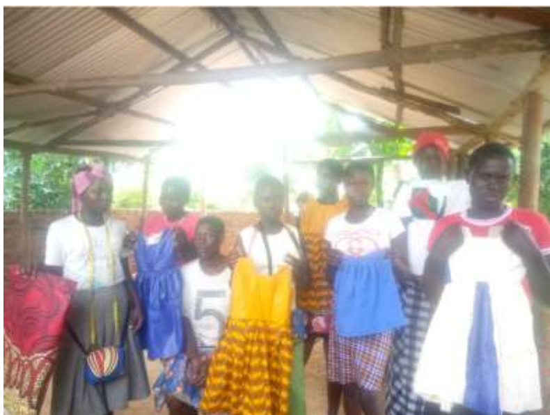
De unge kvinder viser, hvad de har syet som led i undervisningen