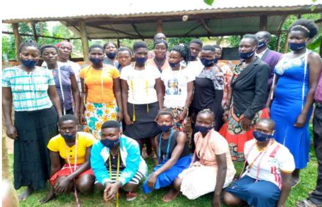
Fællesbillede med studenter, soroptimister og undervisere