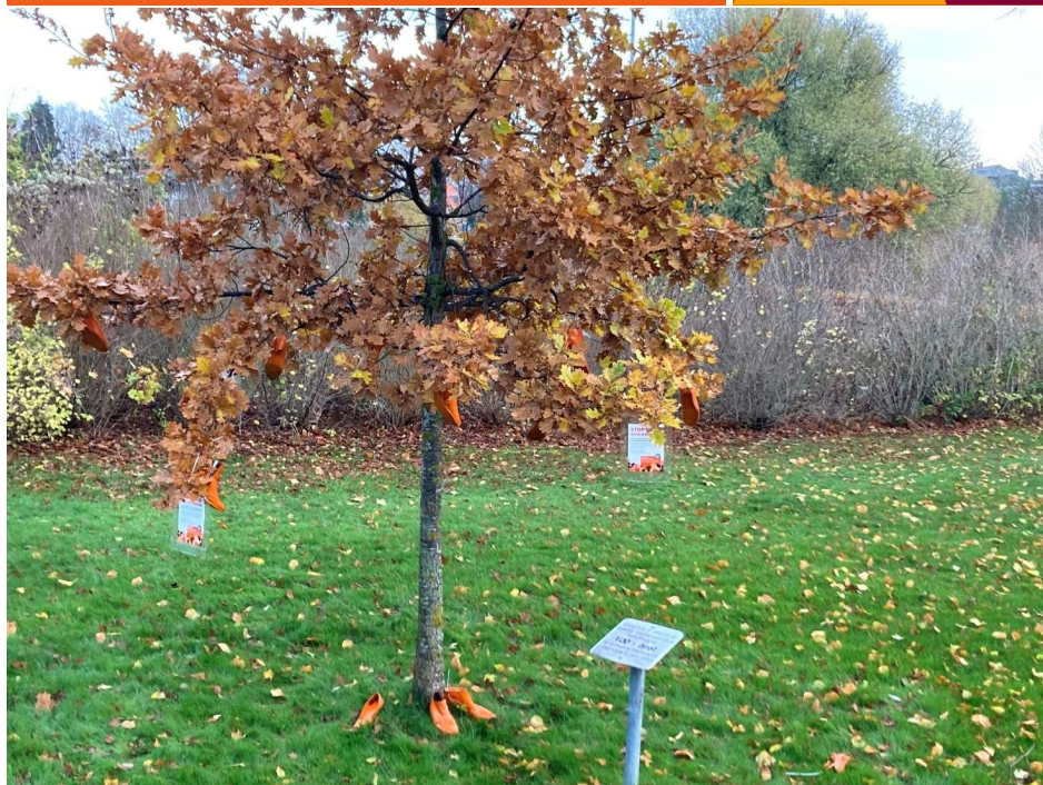
Vort Egetræ, fra 2015.