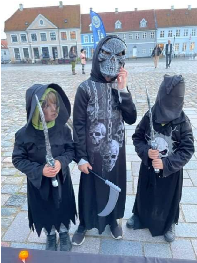
Foto Halloween 2022